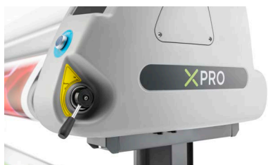
Sollevamento/abbassamento pneumatico del rullo tramite leva