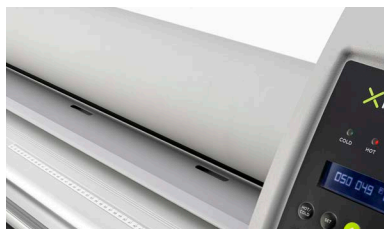
Rulli in silicone antiadesivi